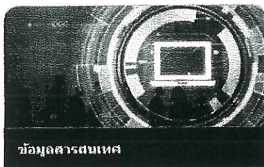
ข้อมูลสารสนเทศ

รหัสหลักสูตร-รหัสรุ่น ให้กรอก รหัสรุ่นที่ระบุไว้ในรายละเอียดกำหนดการสัมมนาเชิงปฏิบัติการฯ โดยกรอกในช่องว่าง ๒ ช่องหลัง ๙ ๙ ๑ ๖ เช่น รุ่นที่ ๑ ให้กรอก ๐๑, รุ่นที่ ๑๐ ให้กรอก ๑๐ ชื่อ-สกุล ผู้เข้าร่วมสัมมนา " ชื่อ-สกุล ผู้ที่จะเข้าร่วมสัมมนา ชื่อหน่วยงาน " ชื่อองค์กรปกครองส่วนท้องถิ่น (อบจ./เทศบาล/อบต.) ที่ผู้เข้าร่วมสัมมนา สังกัดอยู่ อำเภอ " ชื่ออำเภอที่องค์กรปกครองส่วนท้องถิ่นตั้งอยู่ จังหวัด " ชื่อจังหวัดที่องค์กรปกครองส่วนท้องถิ่นตั้งอยู่ รหัสหน่วยงาน " รหัสองค์กรปกครองส่วนท้องถิ่น ประกอบด้วยตัวเลข ๗ หลัก โดยสามารถเปิดดูได้จาก www.dla.go.th