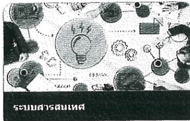
ระบบสารสนเทศ